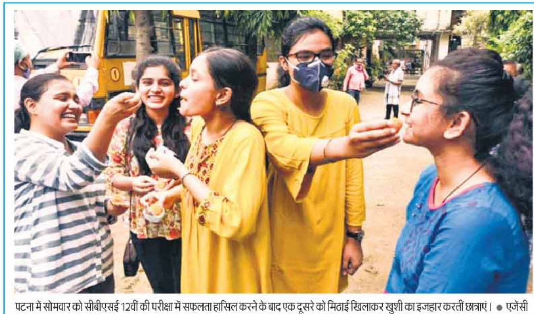
पटना में सोमवार को सीबीएसई 12वीं की परीक्षा में सफलता हासिल करने के बाद एक दूसरे को मिठाई खिलाकर खुशी का इजहार करती छात्राएं। ● एजेसी